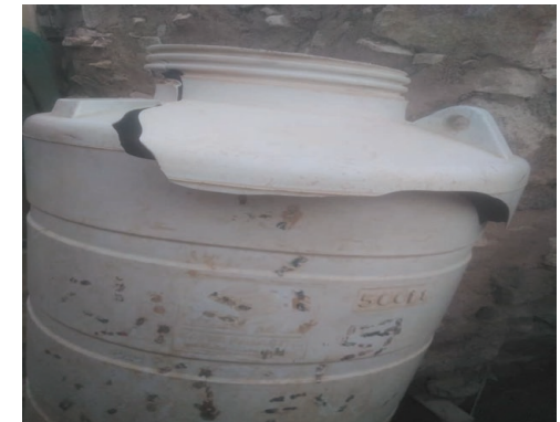
جانب من الأضرار في الماوى الشبكات الحديد ( وتدمير خزانات المياه