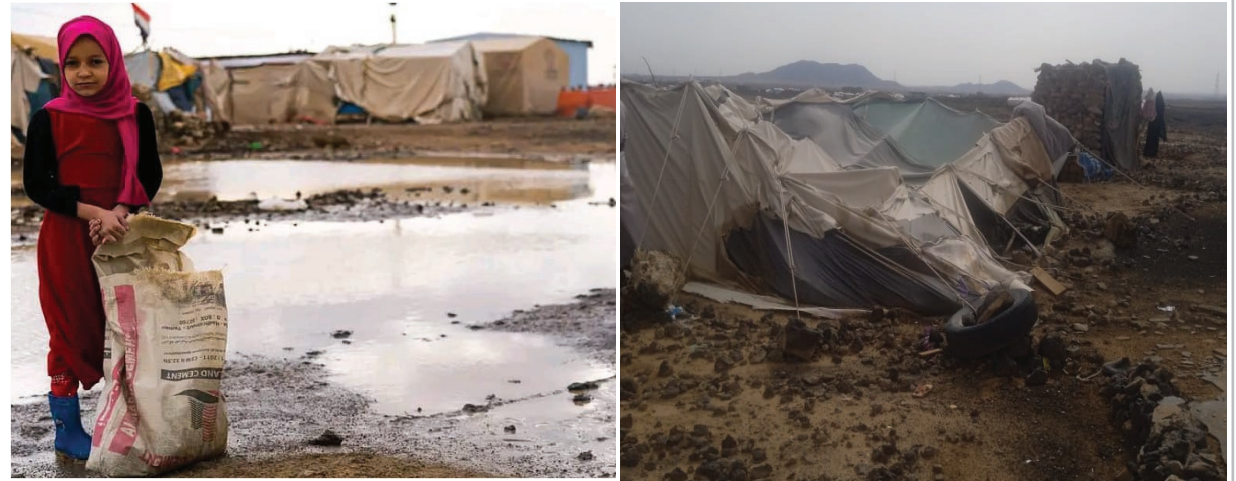
جانبا من المخيمات المتضررة