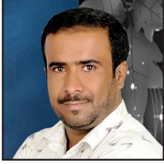
كتابات/ مرسل العباسي

تشكل الحرائق تهديداً كبيراً على مخيمات النزوح، حيث تدمر المأوى الطارئ وتهدد حياة النازحين. يتطلب التصدي لهذا التحدي اعتبار الحماية من الحرائق جزءاً أساسياً من استراتيجيات التأهيل وإدارة الأزمات.