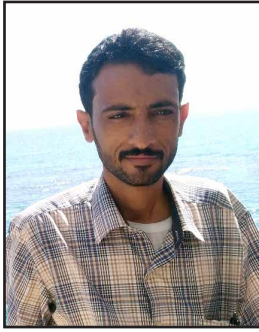
كتابات / حسين مرع

تعتبر فترة الطفولة مرحلة حياتية حاسمة وحساسة في حياة الإنسان، حيث يتشكل فيها الطفل بشكل كامل في مختلف المجالات البدنية والعقلية والاجتماعية. ومن أجل حماية حقوق الأطفال وضمان موهوم السليم وتطورهم الصحيح، أقرت العديد من الدول قوانين واتفاقيات دولية تحدد المعايير والمبادئ المتعلقة بحماية الطفولة. ومع ذلك، يواجه العديد من الأطفال اليوم تحديات واقعية تعارض مع هذه القوانين والأعراف الدولية. سنستكشف في هذه المقالة واقع الطفولة بين الواقع والمنصوص عليه في القوانين والأعراف الدولية.