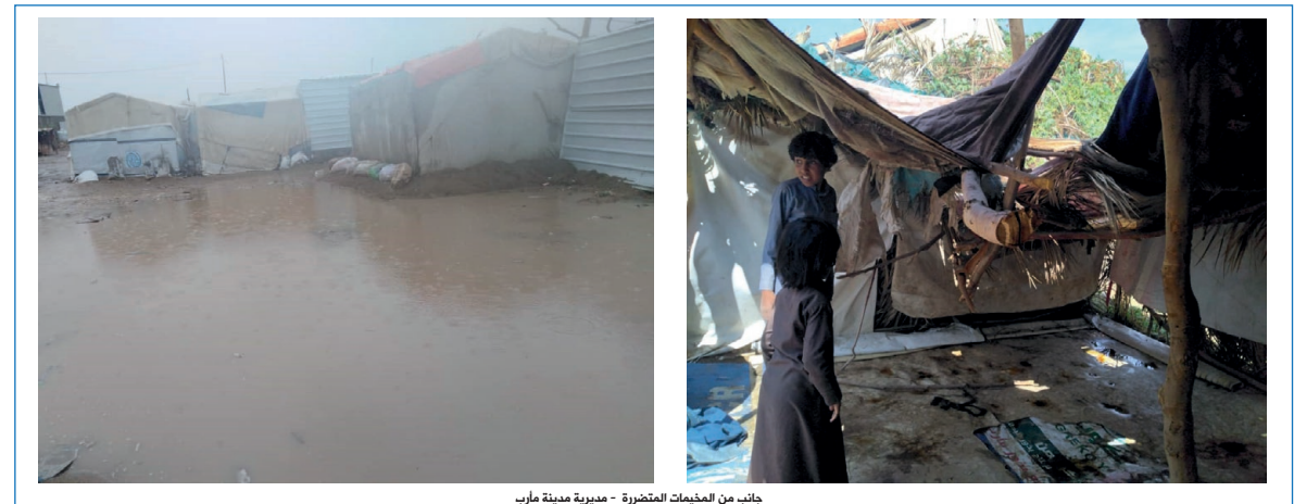
جانب من المخيمات المتضررة - مديرية مدينة مأرب