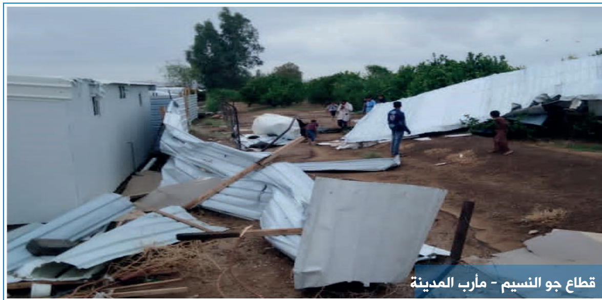
قطاع جو النسيم - مأرب المدينة

سقطت أمطار غزيرة مصحوبة بعواصف شديدة استمرت بالسقوط لساعات رافقها تدفق كبير للسيول من جبال وأودية مديرية صرواح تسببت بجرف وتلف بمئات من المساكن بما فيها من مستلزمات إيوائية وغذائية وتعيش هذه الأسر ظروف انسانية صعبة ونتج عنها اضرار جسيمة وفادحة ، وتسببت السيول بقطع الطرقات وتحولت أجزاء كبيرة من مخيمات وتجمعات الأسر الى مستنقعات وبحيرات من المياه في جميع المديريات حيث أن نوع المأوى المتضرر ( مأوى طارئ) - مأوى مؤقت - عشش - كوتينرات - شبكيات - طرايل - بيوت طينية ) ليس لها القدرة على تحمل تغيرات وتقلبات المناخ في محافظة مأرب و في حال استمرار هذه الامطار وتدفق السيول قد يتفاقم الوضع ويسوء أكثر والوحدة التنفيذية تؤكد بأن ما حدث في المخيمات كارثة حقيقية تحتاج لوقفة جادة من جميع الشركاء والجهات ذات العلاقة للقيام بمسئولياتهم ونهيب بالجميع سرعة التحرك لمعالجة الوضع ووضع حد للكارثة .