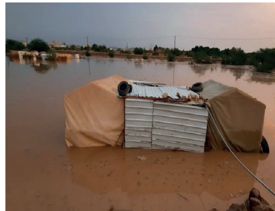
مخيم مصنع عدنان - مديرية مدينة مأرب